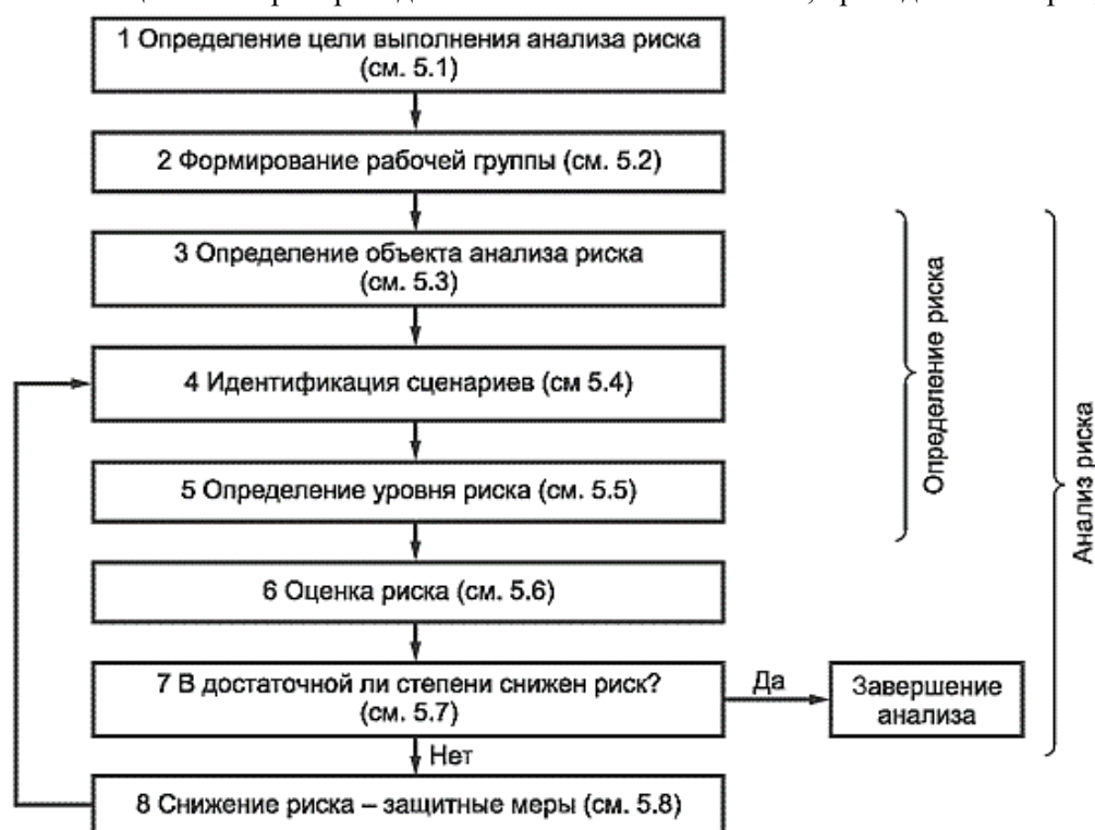
Рисунок 1 - Схема выполнения анализа и снижения риска

Анализ риска и защитные меры проводим в соответствии со схемой, приведенной на рисунке 1.